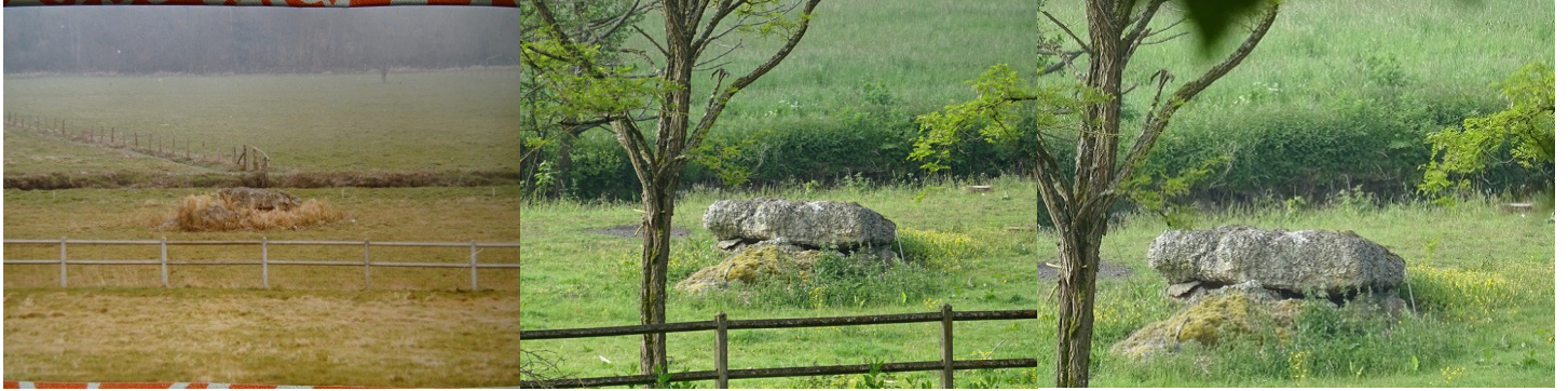
Vue du monument