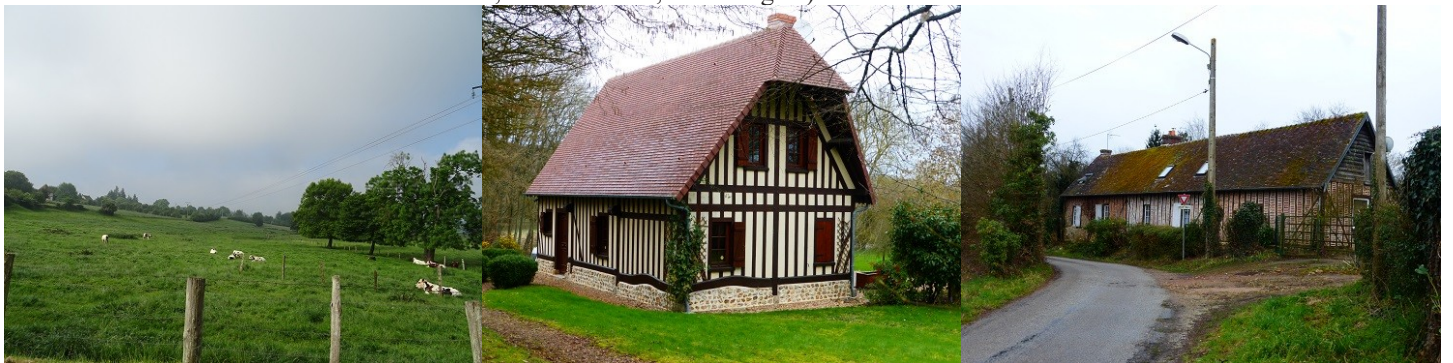
Les abords du monument

Les avis seront cohérents avec ceux émis ces dernières années, à savoir : pas de maisons à volume compliqué (type V, W, Y, ou Z), pentes à 45° pour les volumes principaux, ardoise ou tuile plate de teinte brun vieilli, à 20u/m 2 , avec un débord de toiture de 20cm, enduit de teinte beige clair avec modénatures (au choix : chaînages, encadrement de fenêtres, soubassement, colombage...). *Voir les autres fiches.